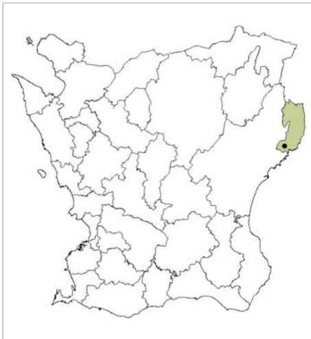
Bromölla kommun med Bromölla markerat.